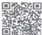
Youtube ชื่อ pattana channel

ทั้งนี้ สำนักงาน กศน. ได้จัดทำสื่อการศึกษาออนไลน์ รายวิชาบังคับตามหลักสูตรการศึกษานอก ระบบระดับการศึกษาขั้นพื้นฐาน พุทธศักราช ๒๕๕๑ และหลักสูตรต่อเนื่อง ด้านอาชีพ เพื่อเป็นแหล่งเรียนรู้ ให้แก่นักศึกษา กศน. โดยสถานศึกษาสามารถสแกน QR Code หรือรับชมผ่านเว็บไซต์ www.youtube.com ช่อง pattana channel