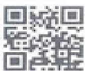
แบบติดตามผลการจัดการเรียนการสอน