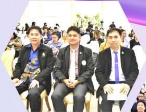
นายโชคดี ศรีธำภาล ศึกษาธิการจังหวัดสุราษฎร์ธานี