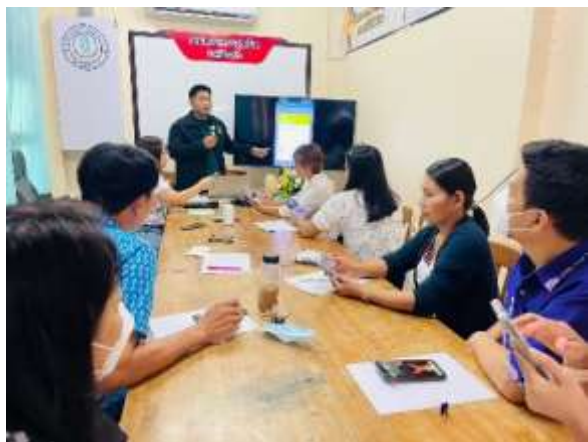
ครูแกนนำอบรมให้ความรู้เกี่ยวกับการใช้แอปพลิเคชัน “พาน้องกลับมาเรียน”