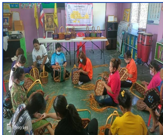
ทักษะอาชีพ “การทำจักสานตะกร้า” เพื่อสนับสนุนการจัดการเรียนรู้หลักสูตรการรู้หนังสือไทย ของ ต.บ้านพราน