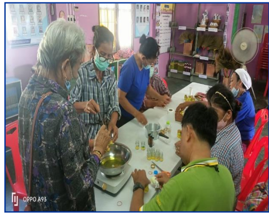
ทักษะอาชีพ “การทำหม่อง” เพื่อสนับสนุนการจัดการเรียนรู้หลักสูตรการรู้หนังสือไทย ของ ต.บ้านพราน