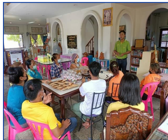
ทักษะอาชีพ “การแปรรูปผลผลิตตามฤดูกาล” เพื่อสนับสนุนการจัดการเรียนรู้หลักสูตรการรู้หนังสือไทย ของ ต.ห้วยไผ่