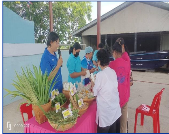
ทักษะอาชีพ “การทำลูกประคบ” เพื่อสนับสนุนการจัดการเรียนรู้หลักสูตรการรู้หนังสือไทย ของ ต.บ้านพราน