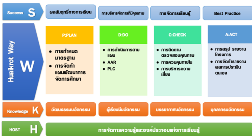
รูปที่ 1 กรอบแนวคิดในการพัฒนานวัตกรรม รูปแบบ HKWS Model

ผลจากการจัดการจัดการเรียนรู้เชิงรุก พัฒนาศตวรรษที่ ๒๑ ด้วย STEAM Design Process เพื่อส่งเสริมสมรรถนะผู้เรียนด้วยโมเดลเศรษฐกิจ BCG ทำให้โรงเรียนมีนวัตกรรมในการยกผลสัมฤทธิ์ทางการเรียน พัฒนาระบบการบริหารจัดการที่มีคุณภาพ การใช้กระบวนการ AAR และ PLC ในการส่งเสริมกระบวนการ STEAM Design Process และทักษะสำคัญในศตวรรษที่ ๒๑ บูรณาการการจัดการเรียนรู้และการวัดและประเมินผล เป็นการลดเวลา ลดภาระของทั้งครูและผู้เรียน จนสามารถสร้างสรรค์ชิ้นงานของตนเอง และนำไปต่อยอดในชีวิตได้ สอดคล้องกับเป้าหมายของหลักสูตร ได้แก่ มาตรฐานตัวชี้วัด คุณลักษณะอันพึงประสงค์ ๘ ประการ และสมรรถนะสำคัญของผู้เรียน ส่งผลให้โรงเรียน ผู้บริหาร ครูและนักเรียนได้รับรางวัลที่ภาคภูมิใจ จากการดำเนินงานทั้งในระดับจังหวัด ระดับเขตพื้นที่การศึกษา และระดับชาติ