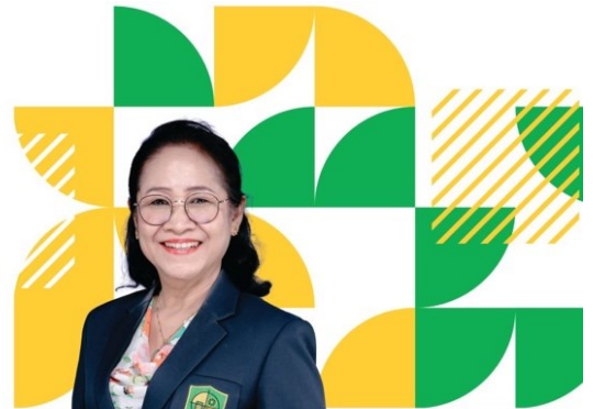
รองผู้อำนวยการโรงเรียน