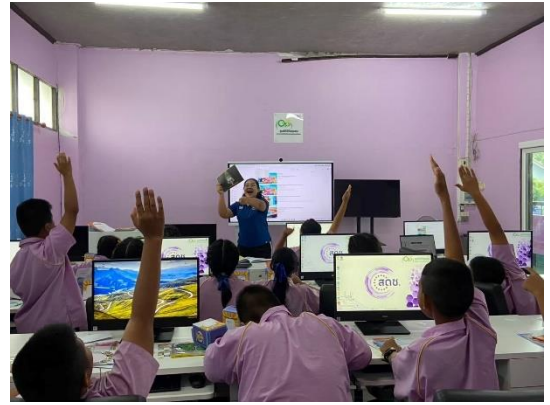
การจัดการเรียนการสอนคอมพิวเตอร์ โรงเรียนนิคมสร้างตนเองจังหวัดสระบุรี (พิบูลสงครามเขต 2)