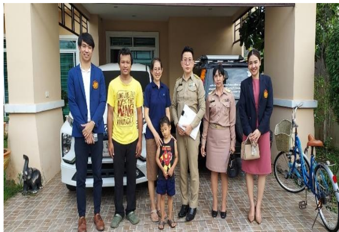
บ้านเรียนน้องดินดี