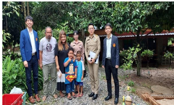
บ้านเรียนลำธาร

สำนักงานเขตพื้นที่การศึกษาประถมศึกษาพะเยาเขต ๒