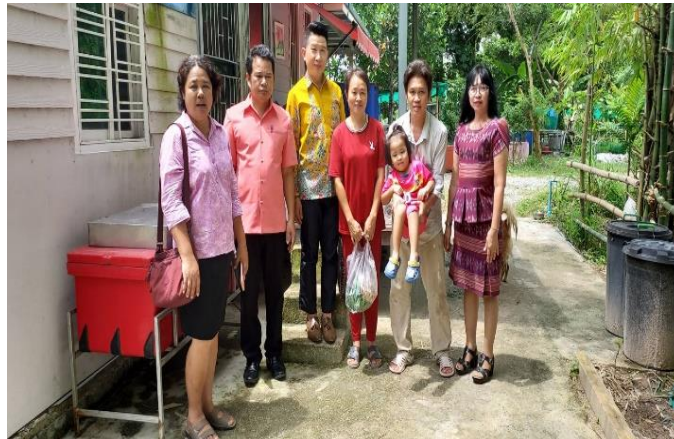
บ้านเรียน ๙ สวนตามรอยพ่อ

เมื่อวันที่ ๒๙ กันยายน ๒๕๖๖ และ วันที่ ๒ ตุลาคม ๒๕๖๖ คณะกรรมการลงพื้นที่ตรวจเยี่ยมและนิเทศการจัดการศึกษาโดยครอบครัว จำนวน ๔ บ้านเรียน ดังนี้ บ้านเรียน ๙ สวนตามรอยพ่อ, บ้านเรียนน้องดินดี, บ้านเรียนปัญญาพัฒนา และบ้านเรียนลำธาร