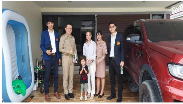
บ้านเรียนบุญพัฒนา