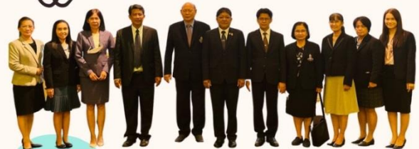
PA SUPPORT TEAM