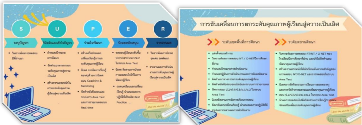
ภาพการทดสอบ SKW๑ AREA TEST

สำนักงานเขตพื้นที่การศึกษาประถมศึกษาสระแก้วดำเนินการประเมินคุณภาพผู้เรียนระดับเขตพื้นที่การศึกษา (SKW๑ Area Test) โดยใช้ระบบการเข้าทดสอบ และระบบรายงานออนไลน์ทดสอบในระดับชั้น ป.๒,ป.๔,ป.๕, ม.๑ และ ม.๒ วิชาภาษาไทย คณิตศาสตร์ วิทยาศาสตร์และเทคโนโลยีและภาษาอังกฤษ ระหว่างวันที่ ๖-๑๒ มีนาคม ๒๕๖๗