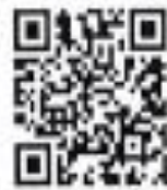
QR CODE แอปพลิเคชัน

กลุ่มบริหารงานบุคคล กลุ่มงานสรรหาและบรรจุแต่งตั้ง โทร. ๐ ๔๔๕๖ ๑๕๖๑ โทรสาร ๐ ๔๔๕๖ ๓๒๘๖