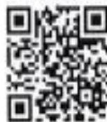
QR CODE ลงทะเบียนการเข้า

ผู้อำนวยการสำนักงานเขตพื้นที่การศึกษาประถมศึกษาสุรินทร์ เขต ๓