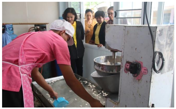
กิจกรรมทำลูกชิ้น หารายได้ระหว่างเรียน