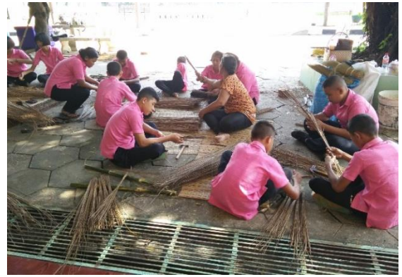
อบรมหลักสูตรระยะสั้นให้กับนักเรียนการทำไม้กวาดทางมะพร้าว