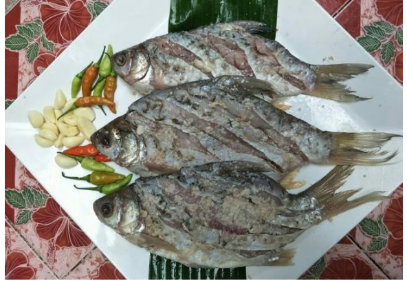
กิจกรรมการแปรรูปอาหาร เพิ่มมูลค่าและถนอม