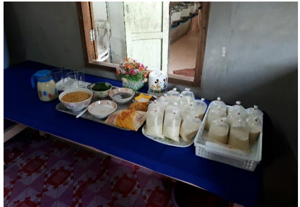
กิจกรรมทำน้ำเต้าหู้ หารายได้ระหว่างเรียน