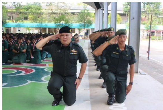
กิจกรรมลูกเสือ และเนตรนารี และกิจกรรมรักษาดินแดน