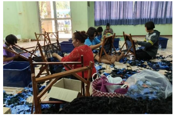
อบรมหลักสูตรระยะสั้นให้กับนักเรียนการทำพรมเช็ดเท้าจากเศษผ้า