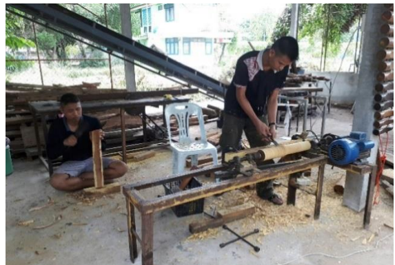
อบรมหลักสูตรระยะสั้นให้กับนักเรียนการทำเครื่องดนตรีพื้นบ้าน โปงกลาง