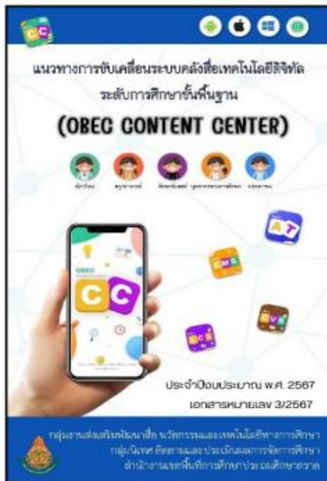
โมเดล/การใช้ระบบสื่อเทคโนโลยี Obec Content Center