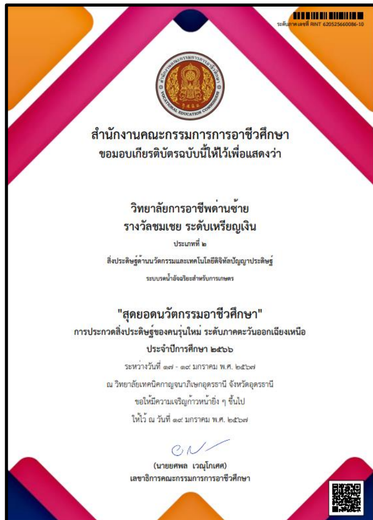
ผลงานเชิงประจักษ์วิทยาลัยการอาชีพด่านซ้าย

แผนกวิชาคอมพิวเตอร์ธุรกิจ วิทยาลัยการอาชีพด่านซ้าย เข้าร่วมการแข่งขันสิ่งประดิษฐ์ของคนรุ่นใหม่ ระดับภาคตะวันออกเฉียงเหนือ ประจำปีการศึกษา 2566