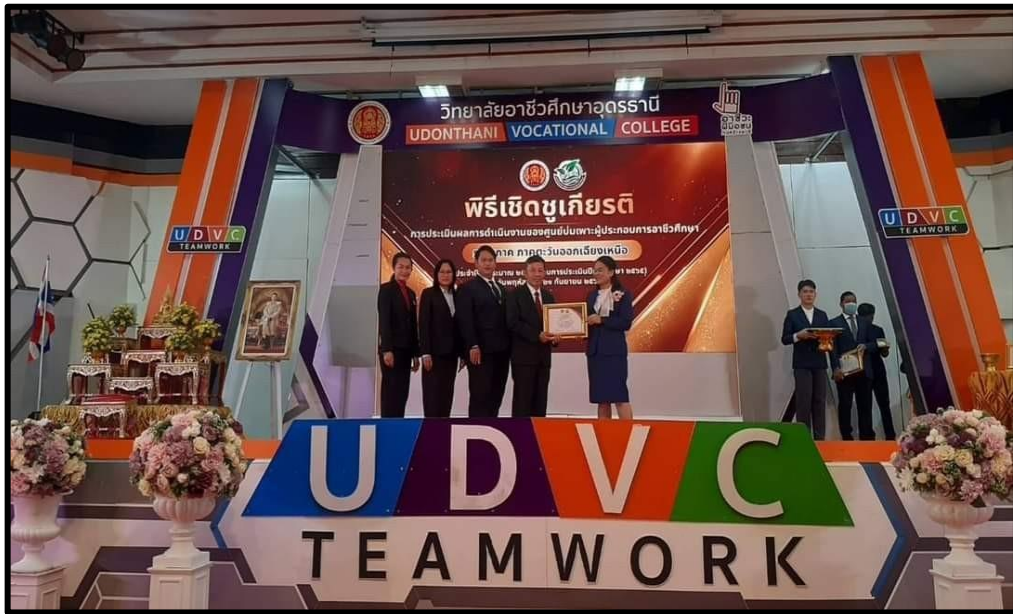
ผลงานเชิงประจักษ์วิทยาลัยการอาชีพด่านซ้าย แผนกวิชาอาหารและโภชนาการ วิทยาลัยการอาชีพด่านซ้าย มีผลการประเมินระดับ 3 ดาว การประเมินศูนย์ป่มเพาะผู้ประกอบการการอาชีวศึกษา ระดับภาคตะวันออกเฉียงเหนือ ประจำปีงบประมาณ 2566