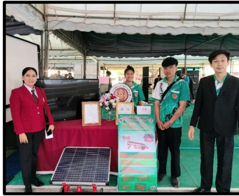
ผลงานเชิงประจักษ์