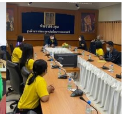
การวางแผนการทำงานในโครงการอาหารเช้า อิ่มท้องสมองดี

A – Activity : ขั้นตอนของการปฏิบัติงานตามแผนที่กำหนด คณะครูร่วมกันดำเนินงานตามหน้าที่ที่ได้รับมอบหมาย โดยคุณครูมีการจัดเวรซื้อวัตถุดิบในการประกอบอาหารทุกสัปดาห์หมุนเวียนไป และมีหน้าที่รับผิดชอบดูแลความเรียบร้อยในการรับประทานอาหารเช้าของนักเรียนทุกวัน ร่วมกับการจัดการโครงการหนูน้อยนักเกษตรกรตัวอย่าง เป็นกิจกรรมในสวนเกษตรแบบผสมผสานตามรอยในหลวงรัชกาลที่ 9 ซึ่งเป็นแหล่งผลิตวัตถุดิบในการประกอบอาหารเช้าและอาหารกลางวัน ได้แก่ เห็ด ผัก ผลไม้ต่าง ๆ การประมงน้ำจืด ได้แก่ ปลาตก ปลานิล ปลาตะเพียน