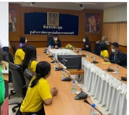
การวางแผนการทำงานในโครงการอาหารเช้า อิ่มท้องสมองดี

A – Activity : ขั้นตอนของการปฏิบัติงานตามแผนที่กำหนด คณะครูร่วมกันดำเนินงานตามหน้าที่ที่ได้รับมอบหมาย โดยคุณครูมีการจัดเวรซื้อวัตถุดิบในการประกอบอาหารทุกสัปดาห์หมุนเวียนไป และมีหน้าที่รับผิดชอบดูแลความเรียบร้อยในการรับประทานอาหารเช้าของนักเรียนทุกวัน ร่วมกับการจัดการโครงการหนูน้อยนักเกษตรกรตัวอย่าง เป็นกิจกรรมในสวนเกษตรแบบผสมผสานตามรอยในหลวงรัชกาลที่ 9 ซึ่งเป็นแหล่งผลิตวัตถุดิบในการประกอบอาหารเช้าและอาหารกลางวัน ได้แก่ เห็ด ผัก ผลไม้ต่าง ๆ การประมงน้ำจืด ได้แก่ ปลาตุ๊ก ปลาไนล ปลาตะเพียน