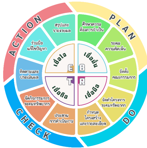
ภาพประกอบ ๑ BRTE Model

การระดมทรัพยากรในสถานศึกษาเป็นกระบวนการที่สำคัญในการสร้างความสำเร็จและพัฒนาคุณภาพการศึกษา โดยเฉพาะอย่างยิ่งในบริบทของการสร้างความเชื่อมั่น เชื่อมือ เชื่อถือ และเชื่อใจ ซึ่งเป็นปัจจัยสำคัญที่ช่วยเสริมสร้างบรรยากาศการทำงานร่วมกันอย่างมีประสิทธิภาพ โดยใช้กระบวนการบริหารงานอย่างมีประสิทธิภาพครบวงจรของเดมมิ่ง (PDCA) เป็นฐานในการดำเนินงาน ดังนี้