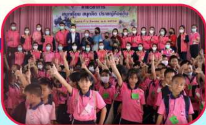
ผู้บริหาร คณะครู และบุคลากรทางการศึกษา ได้จัดค่ายวิชาการปฐมวัย เพื่อส่งเสริมพัฒนาการทั้ง 4 ด้านของเด็กปฐมวัย