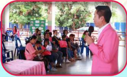
ผู้บริหาร คณะครู และบุคลากรทางการศึกษา ร่วมกันจัดนิทรรศการแสดงผลงานของเด็กปฐมวัยในงานค่ายวิชาการของโรงเรียนอนุบาลโคกศรีสุพรรณ เพื่อให้ผู้บริหาร คณะครู นักเรียน ผู้ปกครองได้เข้าชมผลงานและกิจกรรมส่งเสริมทักษะการเรียนรู้ของเด็กปฐมวัย

ภาพการดำเนินงานการบริหารงานสู่คุณภาพเด็กปฐมวัย ด้วยรูปแบบ PDCA S 7 Model