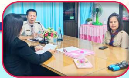
ถอดบทเรียนขยายผลกับผู้บริหาร ศึกษาธิการจังหวัด สพ.สกลนคร เขต ๑ และคณะครูโรงเรียนอนุบาลโคกศรีสุพรรณ ตามโครงการยกระดับคุณภาพการศึกษาปฐมวัย