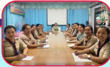
การศึกษาระดับปฐมวัย เป็นโรงเรียนต้นแบบการจัดการศึกษาปฐมวัยอย่างมีคุณภาพ เป็นระยะ ตามแผนการดำเนินงาน