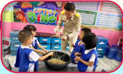
ผู้บริหารได้เข้าเยี่ยมชั้นเรียน ตรวจสอบความเรียบร้อยภายในชั้นเรียน และการจัดสภาพแวดล้อมทั้งภายในและภายนอกให้น่าอยู่ น่าเรียน ตามหลักสูตรการศึกษาปฐมวัยที่ได้กำหนดไว้