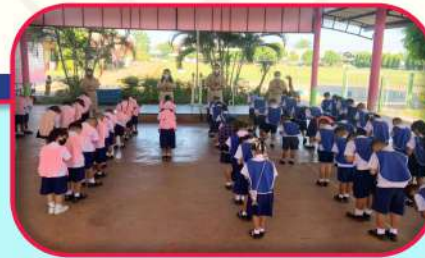
ผู้บริหารได้ให้ความสำคัญในกิจกรรมเช้าแถวเคารพธงชาติ ซึ่งหมายถึงการแสดงความรักชาติ ศาสน์ กษัตริย์ และกิจกรรมเบร็นสมองในตอนเช้า