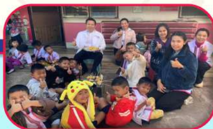
ผู้บริหาร คณะครู และบุคลากรทางการศึกษาได้สนับสนุนการทำกิจกรรมต่างๆ ของระดับปฐมวัย ในการส่งเสริมให้เด็กเกิดทักษะที่จำเป็นในชีวิตประจำวัน ที่มีผลต่อพัฒนาการ และเหมาะสมตามวัย