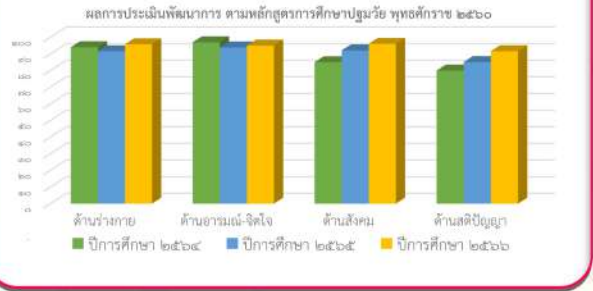
ภาพที่ ๑ ร้อยละพัฒนาการทั้ง ๔ ด้าน จำนวนเด็กปีการศึกษา

จากตารางที่ 1 และภาพที่ 1 พบว่า ปีการศึกษา 2564 เด็กปฐมวัยมีระดับคุณภาพรายพัฒนาการ อยู่ใน ระดับดีทุกด้าน โดยพัฒนาการด้านสังคม มีผลการประเมินระดับดี ร้อยละ 97 รองลงมาคือพัฒนาการด้านร่างกาย มีผลการประเมินระดับดี ร้อยละ 94 พัฒนาการด้านอารมณ์ - จิตใจ มีผลการประเมินระดับดี ร้อยละ 85 และพัฒนาการด้านสติปัญญา มีผลการประเมินระดับดี ร้อยละ 80 ตามลำดับ ปีการศึกษา 2565 เด็กปฐมวัยมีระดับคุณภาพรายพัฒนาการ อยู่ในระดับดีทุกด้าน โดยพัฒนาการด้านอารมณ์ - จิตใจสังคม มีผลการประเมินระดับดี ร้อยละ 93.9 รองลงมาคือพัฒนาการด้านสังคม มีผลการประเมินระดับดี ร้อยละ 92.1 พัฒนาการด้านร่างกาย มีผลการประเมินระดับดี ร้อยละ 91.6 และพัฒนาการด้านสติปัญญา มีผลการประเมินระดับดี ร้อยละ 85.1 ตามลำดับ ปีการศึกษา 2566 เด็กปฐมวัยมีพัฒนาการอยู่ใน ระดับดีทุกด้าน โดยพัฒนาการด้านสังคม มีผลการประเมินระดับดี ร้อยละ 96.05 รองลงมาคือพัฒนาการด้านร่างกาย มีผลการประเมินระดับดี ร้อยละ 95.8 พัฒนาการด้านอารมณ์ - จิตใจ มีผลการประเมินระดับดี ร้อยละ 95 และพัฒนาการด้านสติปัญญา มีผลการประเมินระดับดี ร้อยละ 91.65 ตามลำดับและในทุกปีการศึกษาพัฒนาการด้านสติปัญญา มีผลการประเมินระดับดีร้อยละที่สูงขึ้น