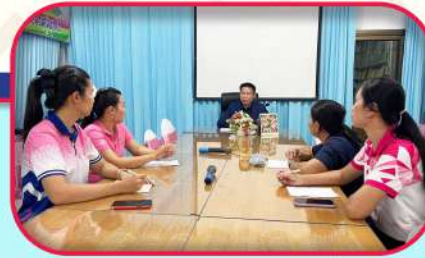
มีการประเมิน และรายงานความก้าวหน้าของดำเนินงาน เป็นระยะจะมีการทบทวนการดำเนินงาน และใช้กระบวนการสร้างชุมชนแห่งการเรียนรู้ทางวิชาชีพ (PLC) ในการปรับปรุงพัฒนางาน และบุคลากร อย่างต่อเนื่อง