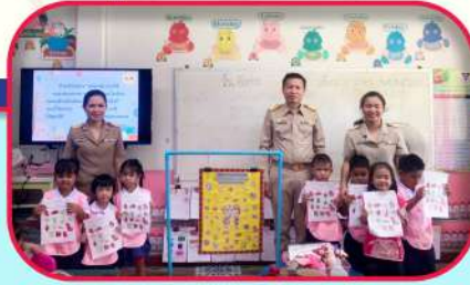
ผู้บริหารได้เข้าניתรรศการสอบของคณะครูระดับปฐมวัย เป็นรายชั้นห้องทั้งเรียน