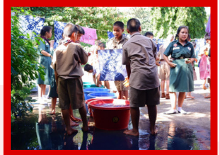
กิจกรรมเสริมสร้างทักษะอาชีพให้แก่นักเรียน