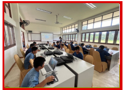
การสืบค้นข้อมูล ผ่านสื่อคอมพิวเตอร์