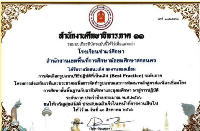
รางวัลชนะเลิศผลงานยอดเยี่ยม การคัดเลือก/รูปแบบ (Best Practice) ระดับภาค ปีงบประมาณ ๒๕๖๖