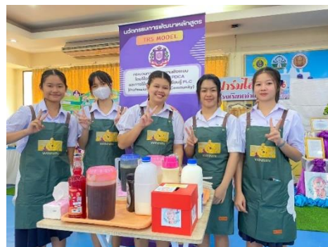
การเผยแพร่ผลงานหลักสูตรการจัดการธุรกิจค้าปลีก