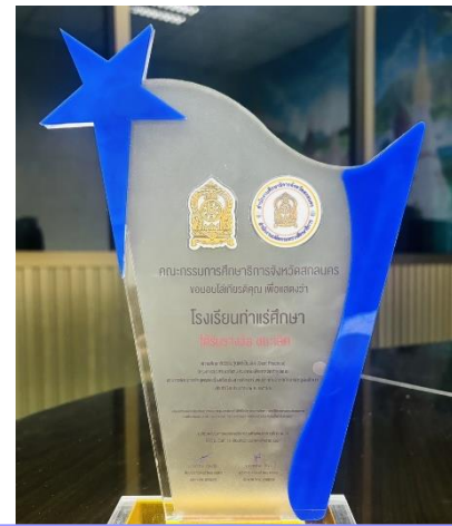
รางวัลชนะเลิศผลงานยอดเยี่ยม การคัดเลือก/รูปแบบ (Best Practice) ระดับจังหวัด ปีงบประมาณ ๒๕๖๗