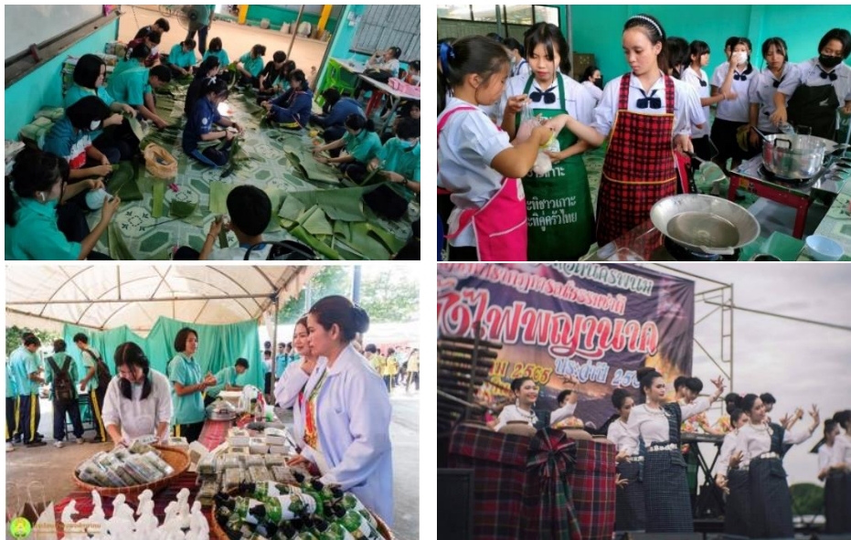
ผู้เรียนเกิดทักษะทางวิชาชีพ สามารถเชื่อมโยงความรู้ที่ได้รับจากในห้องเรียนและแหล่งเรียนรู้นอกห้องเรียน มาประยุกต์ใช้ในการดำเนินชีวิต และสร้างรายได้ให้ครอบครัวและชุมชน