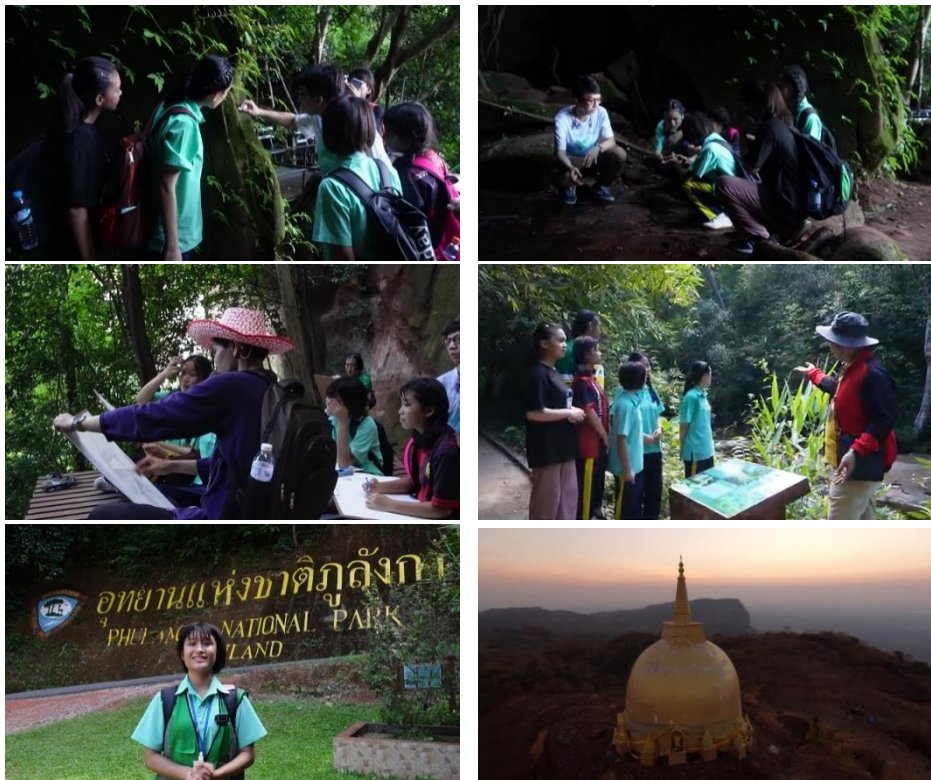
ผู้เรียนได้เรียนรู้และเข้าใจความหลากหลายของสิ่งมีชีวิต สภาพภูมิศาสตร์และธรณีวิทยา เรียนรู้เกี่ยวกับ พุทธศาสนา วิถีชีวิต และประเพณีชาวบ้าน จากการบูรณาการรายวิชาต่างๆ บนอุทยานแห่งชาติภูถ้ำกลองชัย