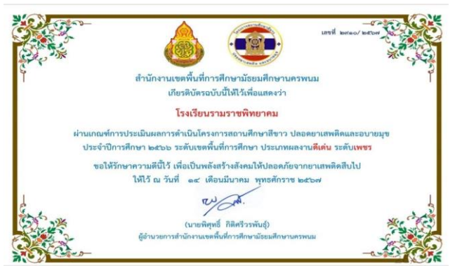
ผ่านเกณฑ์การประเมินผลการดำเนินโครงการสถานศึกษาสีขาว ระดับเพชร