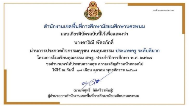
รางวัลการประกวดกิจกรรมคุณชน คนคุณธรรม ประเภทครู ระดับดีมาก