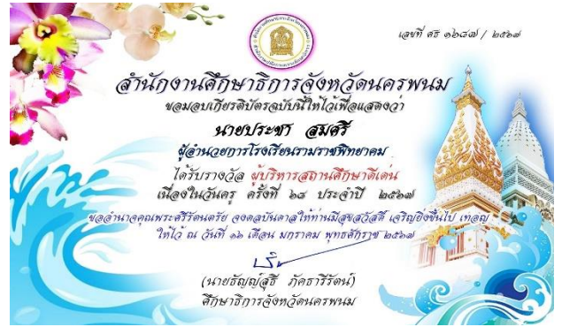
รางวัลผู้บริหารสถานศึกษาดีเด่น เนื่องในวันครู ครั้งที่ ๖๘ ประจำปี ๒๕๖๗