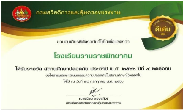
รางวัลสถานศึกษาปลอดภัย ปีที่ ๔ ติดต่อกัน