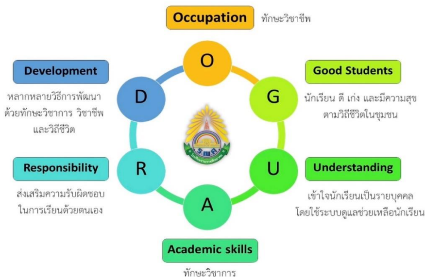
รูปภาพที่ ๒ แสดงรูปแบบนวัตกรรมจัดการศึกษาแบบบูรณาการ วิชาการ วิชาชีพ และวิถีชีวิต (๓ วิ) : O-GUARD Model (โอกาส โมเดล)

จากการดำเนินงานตามกระบวนการพัฒนางานตามรูปแบบวงจร PDCA นี้ จะถูกขับเคลื่อนการพัฒนาสู่ผลสำเร็จตามวัตถุประสงค์ โดยการใช้รูปแบบ O-GUARD คือ การจัดการเรียนรู้รูปแบบบูรณาการ วิชาการ วิชาชีพ และวิถีชีวิต (๓ วิ) ดังนี้