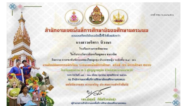
รางวัลเหรียญทองชนะเลิศ การขับร้องเพลงไทยลูกทุ่ง ประเภทหญิง ม.ปลาย