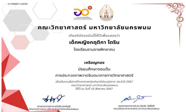
รางวัลเหรียญทอง การประกวดภาพวาดจินตนาการทางวิทยาศาสตร์ ม.ต้น