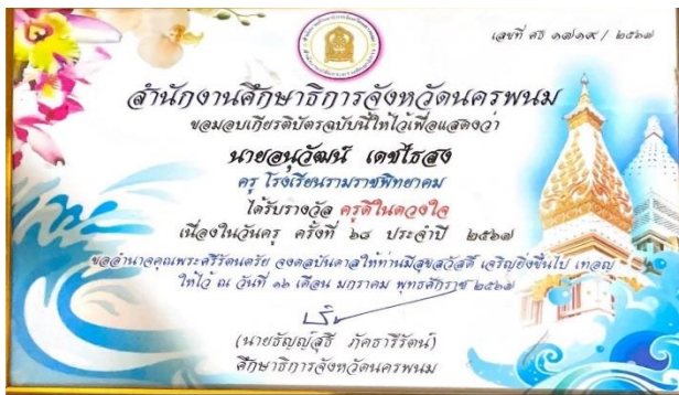
รางวัลครูดีเด่นดวงใจ เนื่องในวันครู ครั้งที่ ๖๘ ประจำปี ๒๕๖๗