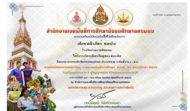
รางวัลเหรียญทองชนะเลิศ การขับร้องเพลงสากล ประเภทชาย ม.ต้น