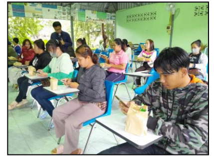
การทำสื่อการเรียนการสอนผ่าน Internet

๑.๓.๒ การเรียนรู้ผ่านห้องสมุดประชาชนอำเภอปลาปาก โดยการจัดกิจกรรมส่งเสริมการอ่านทั้งภายในและภายนอกห้องสมุดเป็นการจัดกิจกรรมส่งเสริมการอ่านอย่างต่อเนื่อง