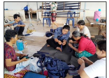
การเย็บกระเป๋าจากผ้าพื้นเมือง