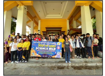
ศึกษาดูงาน ณ ศูนย์วิทยาศาสตร์เพื่อการศึกษานครพนม