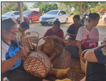
การสานตะกร้าหวายเทียม

๑.๓.๓ การเรียนรู้จากภูมิปัญญาท้องถิ่น โดยการพัฒนาส่งเสริมทักษะด้านอาชีพ ซึ่งช่วยให้ผู้เรียนได้รับความรู้ และสามารถนำไปใช้ได้จริง