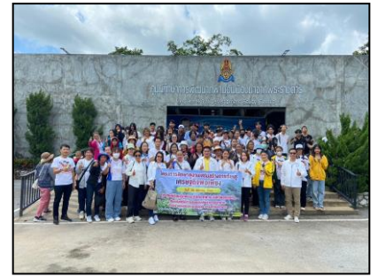
ศึกษาดูงาน ณ ศูนย์ศึกษาการพัฒนาภูพานอันเนื่องมาจากพระราชดำริจังหวัดสกลนคร