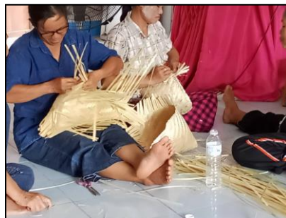
การจักสาน