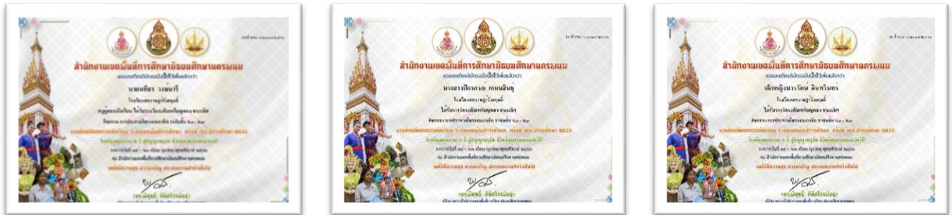
ภาพประกอบที่ ๔ ผลงานศิลปหัตถกรรมนักเรียน ครั้งที่ ๗๑ การประกวดโครงงานอาชีพ ระดับเขตพื้นที่การศึกษา

ในการผลิตนวัตกรรมเรื่อง การประดิษฐ์เครื่องพัสดราภรณ์ โดยใช้โครงงานเป็นฐาน (Project Based Learning หรือ PBL) สู่การจัดการเรียนรู้แบบบูรณาการด้านการส่งเสริมการศึกษา เพื่อพัฒนาทักษะอาชีพ และขีดความสามารถในการแข่งขันในการสร้างสรรค์ผลงานจนนำไปสู่การประกอบอาชีพในอนาคตได้ มีการผลิตนวัตกรรมอย่างมีลำดับขั้นตอน และเป็นระบบจนเกิดผลสำเร็จตามวัตถุประสงค์ทุกประการ ได้รับรางวัลระดับเหรียญทอง ชนะเลิศ กิจกรรมการประกวดโครงงานอาชีพ ระดับชั้น ม.๑ - ม.๓ งานศิลปหัตถกรรมนักเรียน ระดับเขตพื้นที่การศึกษา ครั้งที่ ๗๑ ปีการศึกษา ๒๕๖๖ สำนักงานเขตพื้นที่การศึกษามัธยมศึกษานครพนม