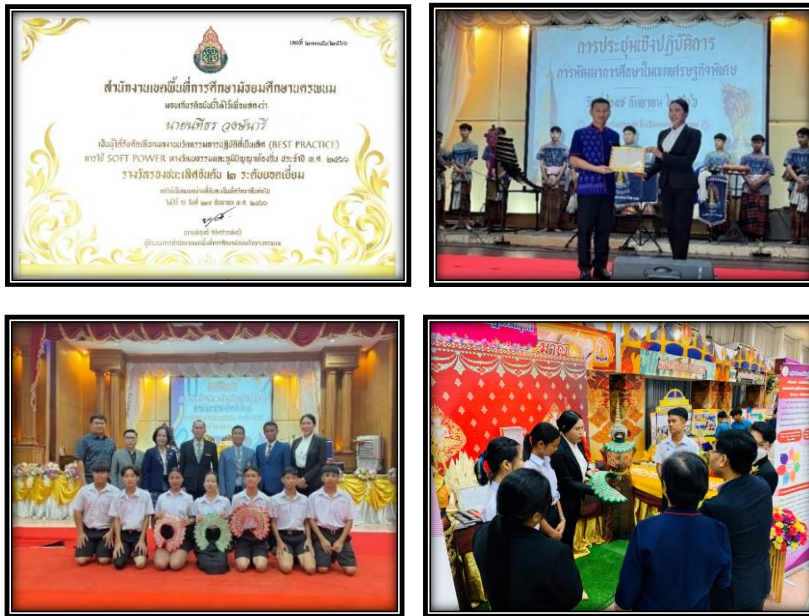
ภาพประกอบที่ ๒ ผลงานนวัตกรรมการปฏิบัติเป็นเลิศ “Best Practice”

ทางวัฒนธรรมและภูมิปัญญาท้องถิ่น ชื่อผลงาน : การส่งเสริมภูมิปัญญาท้องถิ่นในการประดิษฐ์เครื่องศิราภรณ์และเครื่องประดับนาฏศิลป์ไทย โดยใช้รูปแบบ SIRAPON Model (ศิราภรณ์ โมเดล) โรงเรียนสหราษฎร์รังสฤษดิ์