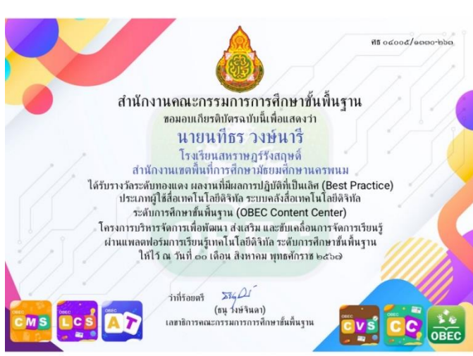
ภาพประกอบที่ ๕ ผลงานที่มีผลการปฏิบัติที่เป็นเลิศ (Best Practice)

ผลงานที่มีผลการปฏิบัติที่เป็นเลิศ (Best Practice) โครงการบริหารจัดการเพื่อพัฒนา ส่งเสริม และขับเคลื่อนการจัดการเรียนรู้ผ่านแพลตฟอร์มการเรียนรู้เทคโนโลยีดิจิทัล (OBEC Content Center) ระดับการศึกษาขั้นพื้นฐาน ได้รับรางวัล ระดับทองแดง การประดิษฐ์เครื่องพัสดราภรณ์ สำหรับนักเรียนชั้นมัธยมศึกษา ปีที่ ๓ โรงเรียนสหราษฎร์รังสฤษดิ์ โดยใช้สื่อเทคโนโลยีดิจิทัล OBEC Content Center