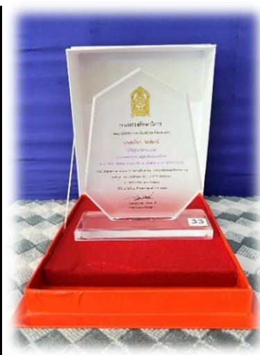
ภาพประกอบที่ ๓ ผลงาน REO ๑๑ MOE AWARDS