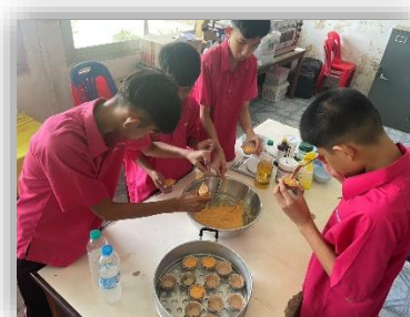
กิจกรรมงานอาชีพขนมไทย