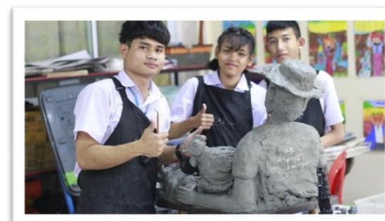
รางวัลชนะเลิศปั้นดินน้ำมัน งานศิลปหัตถกรรมนักเรียน ครั้งที่ ๗๑