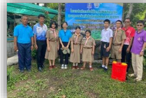
กิจกรรมงานอาชีพเลี้ยงไก่ไข่อารมณ์ดี