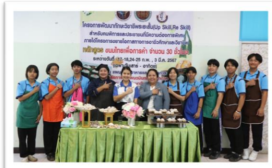
การฝึกอาชีพหลักสูตรระยะสั้น