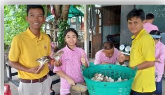
กิจกรรมงานอาชีพเพาะเห็ดนางฟ้า