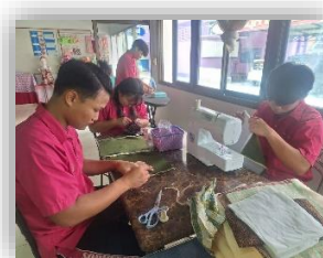
กิจกรรมงานอาชีพ กล่องกระดาษทิชชู จากเศษผ้า