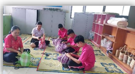
กิจกรรมงานอาชีพสานตะกร้าพลาสติก