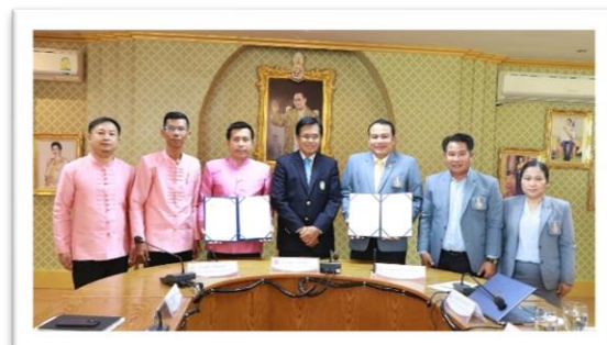
MOU ร่วมกับวิทยาลัยการอาชีพฯ