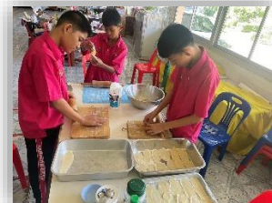
กิจกรรมงานอาชีพขนมเบเกอรี่