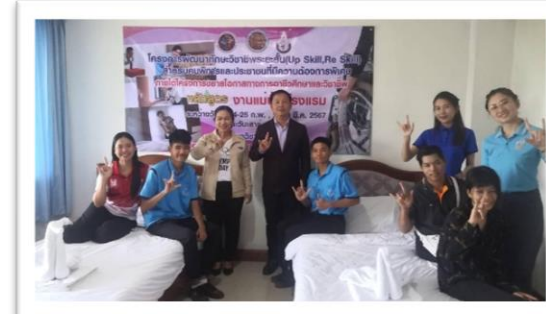
อาชีพแม่บ้านโรงแรม