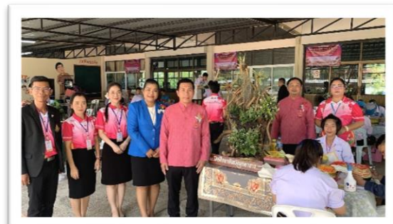
รางวัลชนะเลิศการแกะสลักผักและผลไม้ งานศิลปหัตถกรรมนักเรียน ครั้งที่ ๗๑