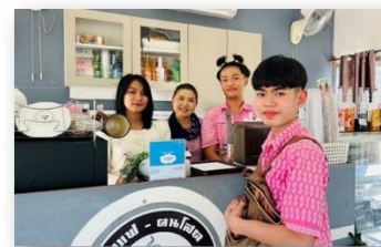
กิจกรรมงานอาชีพกาแฟคนโสด