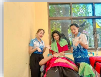
กิจกรรมงานอาชีพเสริมสวย/ตัดผมชาย