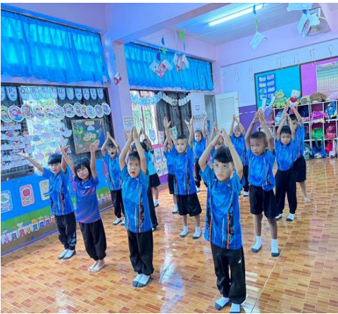
กิจกรรมโยคะแปลงร่าง