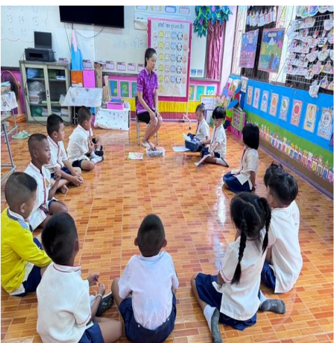
กิจกรรมเล่านิทานเรื่อง “ช้างน้อยซีโมโห”