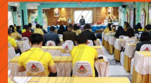
วิสัยทัศน์ผู้บริหารสถานศึกษา ในการพัฒนาสู่ความสำเร็จ 1 อำเภอ 1 โรงเรียนคุณภาพ