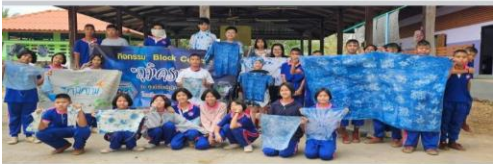
👍 ถูกใจ 🗨 แสดงความคิดเห็น 📩 ส่ง ➦ แชร์