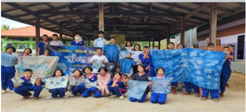
👍 ถูกใจ 🗨 แสดงความคิดเห็น 📩 ส่ง ➦ แชร์