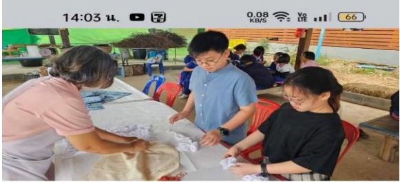
👍 ถูกใจ 🗨 แสดงความคิดเห็น 📩 ส่ง ➦ แชร์