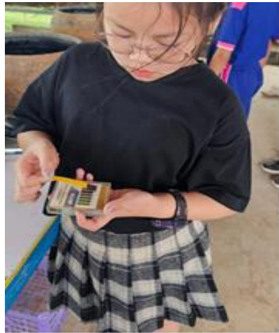
👍 ถูกใจ 🗨 แสดงความคิดเห็น 🔄 ส่ง ➡ แชร์