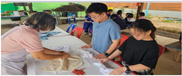
👍 ถูกใจ 🗨 แสดงความคิดเห็น 📩 ส่ง ➦ แชร์