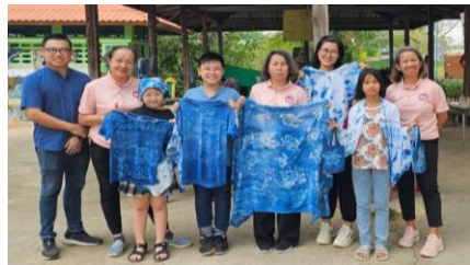
👍 ถูกใจ 🗨 แสดงความคิดเห็น 🔄 ส่ง ➡ แชร์