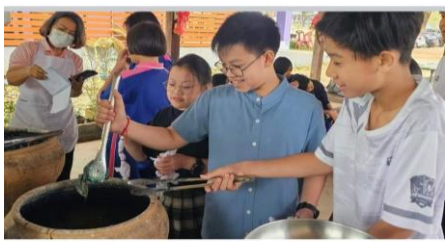
👍 ถูกใจ 🗨 แสดงความคิดเห็น 🔄 ส่ง ➡ แชร์