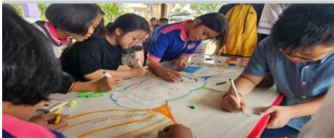
👍 ถูกใจ 🗨 แสดงความคิดเห็น 🔄 ส่ง ➡ แชร์