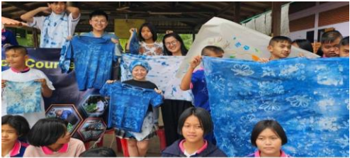
👍 ถูกใจ 🗨 แสดงความคิดเห็น 📩 ส่ง ➦ แชร์