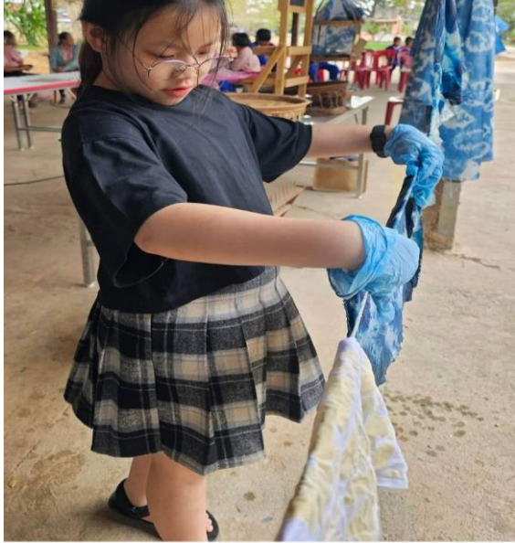
👍 ถูกใจ 🗨 แสดงความคิดเห็น 📩 ส่ง ➦ แชร์