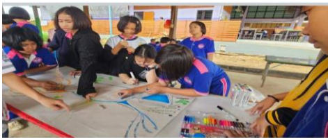
👍 ถูกใจ 🗨 แสดงความคิดเห็น 🔄 ส่ง ➡ แชร์