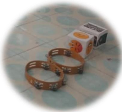
ฮิโมชั้นบล็อก