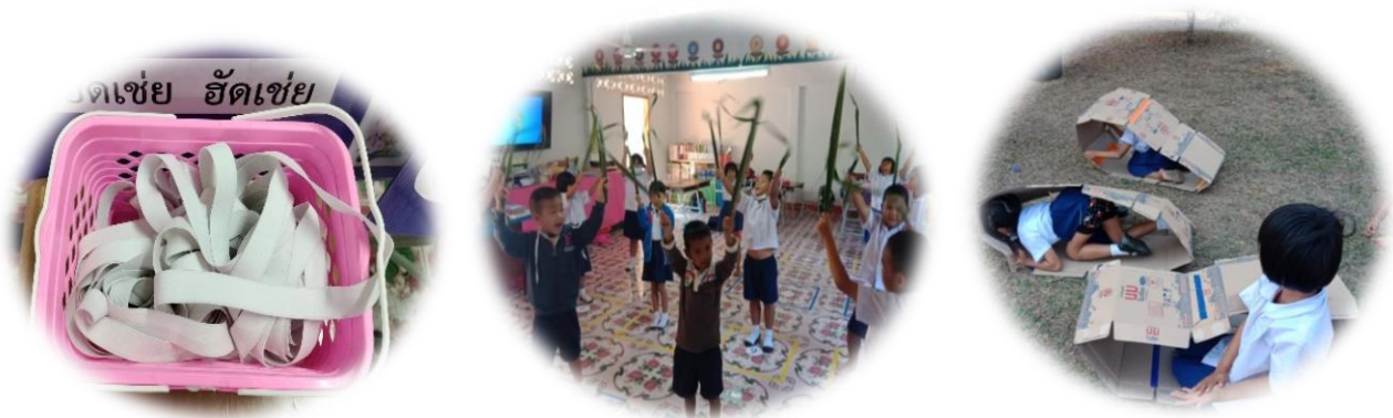
ตัวอย่างวัสดุ - อุปกรณ์ในชุดกิจกรรมทางกาย

วัสดุอุปกรณ์ที่ใช้ในกิจกรรมทางกายประสานการชี้แนะ ส่งเสริมพฤติกรรมด้านอารมณ์ของเด็กปฐมวัย โดยเด็กและครูร่วมกันระดมความคิดจากสื่อที่มีในท้องถิ่น