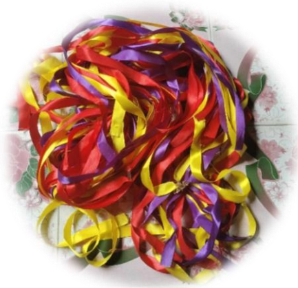
ริบบิ้นผ้า