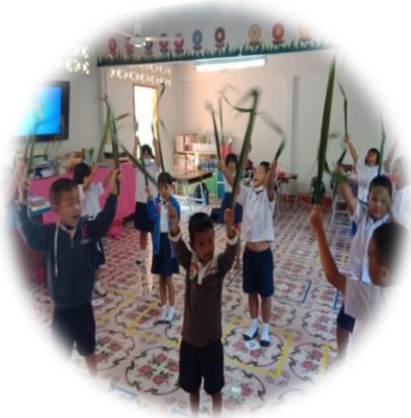
ใบมะพร้าว