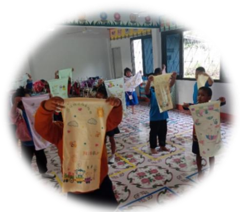
ผ้าขนหนู