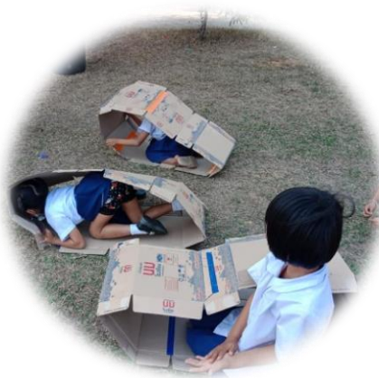
กล่องนมต่อกัน