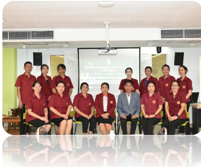
โครงการอบรมเชิงปฏิบัติการสร้างข้อสอบออนไลน์ สำหรับครูผู้สอน