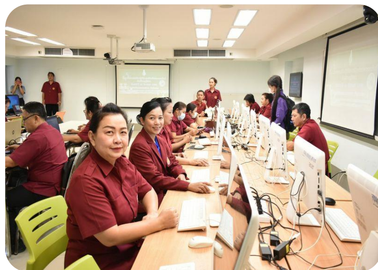
โครงการจัดทำข้อสอบออนไลน์ ด้วย Google Form

สถานศึกษามีโครงการจัดทำข้อสอบออนไลน์ ด้วย Google Form แก้ไขปัญหาในเรื่องงบประมาณ ไม่เพียงพอ อีกทั้งเป็นการส่งเสริมให้ครูได้มีการนำเทคโนโลยีมาใช้ในการจัดการเรียนการสอน และลดกระดาษ