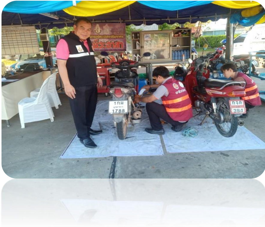
การแข่งขันทักษะ ประจำปีการศึกษา 2566 ระดับภาค