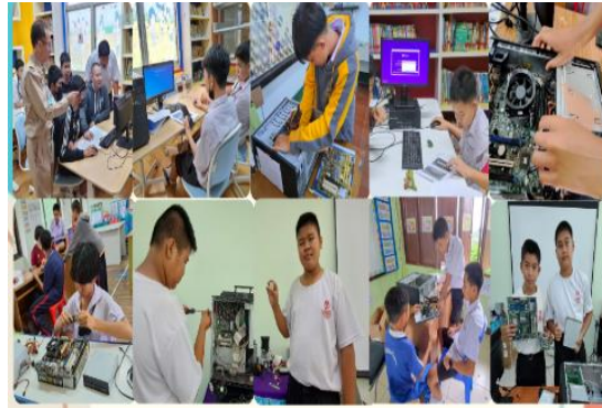
หลักสูตรวิชาซีพระยะสั้น วิชา งานซ่อมบำรุงคอมพิวเตอร์

2) การพัฒนาสมรรถนะอาชีพให้แก่กลุ่มผู้เรียน การอบรมอาชีพพระยะสั้น การพัฒนาสมรรถนะอาชีพให้แก่ผู้เรียน ในสาขาวิชา คหกรรม อดสาหกรรม และศิลปะศาสตร์ การพัฒนาสมรรถนะอาชีพให้แก่กลุ่มผู้เรียน การอบรมอาชีพพระยะสั้น การพัฒนาสมรรถนะอาชีพให้แก่ผู้เรียน ในสาขาวิชา คหกรรม อดสาหกรรม และศิลปะศาสตร์