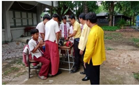
หลักสูตรวิชาซีพระยะสั้น วิชา งานช่างยนต์