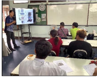
หลักสูตรวิชาชีพพระยะสัน วิชา ติดตั้งและบำรุงเครื่องปรับอากาศ