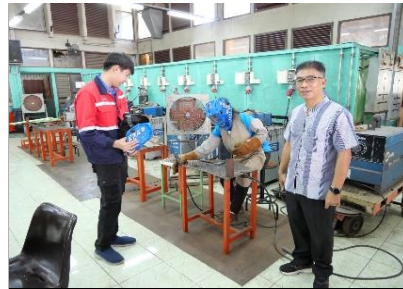
หลักสูตรวิชาชีพพระยะสัน วิชา งานเชื่อมงานผลิตภัณฑ์,งานเชื่อมไฟฟ้า