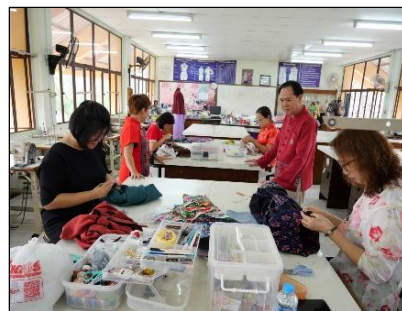
หลักสูตรวิชาชีพพระยะสัน วิชา เสื้อสมัยนิยม,กางเกงสตรีเบื้องต้น, กระเป๋าสตางค์ทำมือ, ชุดติดกันสมัยนิยม