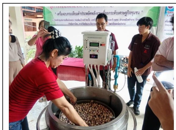
รูปแสดง การอบรมการใช้งานเครื่องอบกระเทียมดำ