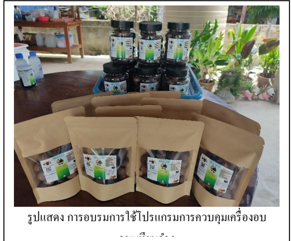
รูปแสดง การอบรมการใช้โปรแกรมการควบคุมเครื่องอบ