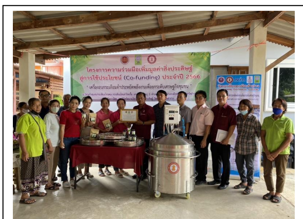
รูปแสดง การส่งมอบเครื่องอบฯให้วิสาหกิจชุมชนได้นำไปใช้งานจริง