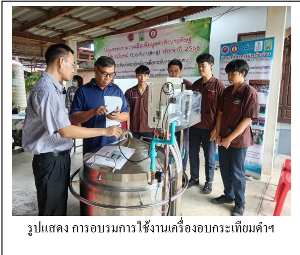
รูปแสดง การอบรมการใช้งานเครื่องอบกระเทียมดำ