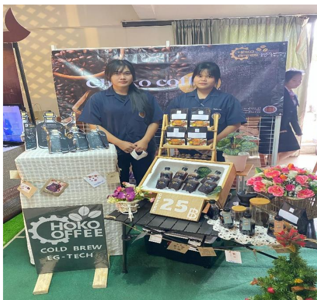
ส่งเสริมให้ผู้เรียนจำหน่ายสินค้า เพื่อให้มีรายได้ระหว่างเรียน