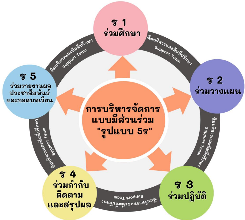
กรอบแนวคิดการขับเคลื่อนการดำเนินงาน