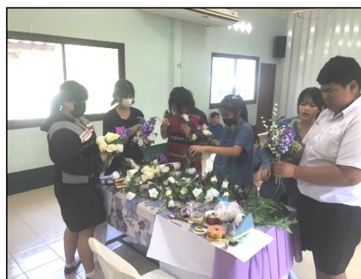
ส่งเสริมการจัดการเรียนการสอนแบบ Active Learning