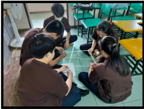
ส่งเสริมการจัดการเรียนการสอนแบบ Active Learning