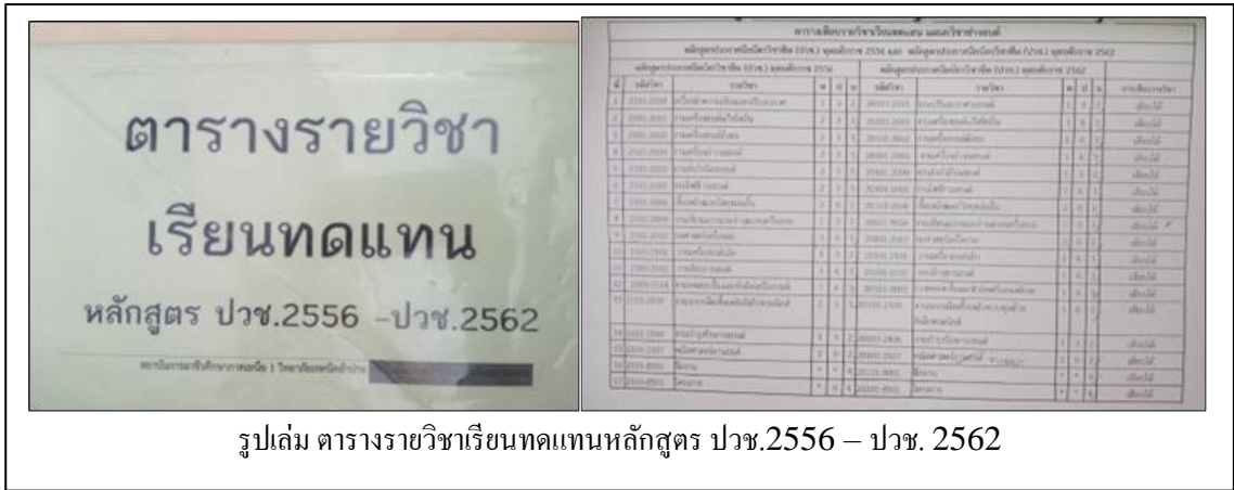
รูปเล่ม ตารางรายวิชาเรียนทดแทนหลักสูตร ปวช.2556 – ปวช. 2562