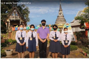
รักแผ่นดินเมืองฝางสว่างคูรี

สำนักงานเขตพื้นที่การศึกษาประถมศึกษาอุตรดิตถ์ เขต 1