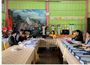
หลักสูตรต้านทุจริต