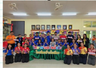
ศูนย์วิทยาศาสตร์วิทย์พลังสืบ