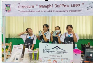
"Namphi Coffer เออะ"