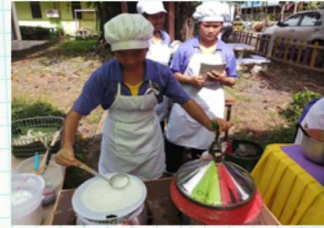
มหัศจรรย์ข้าวพันผัก เพื่อสุขภาพ