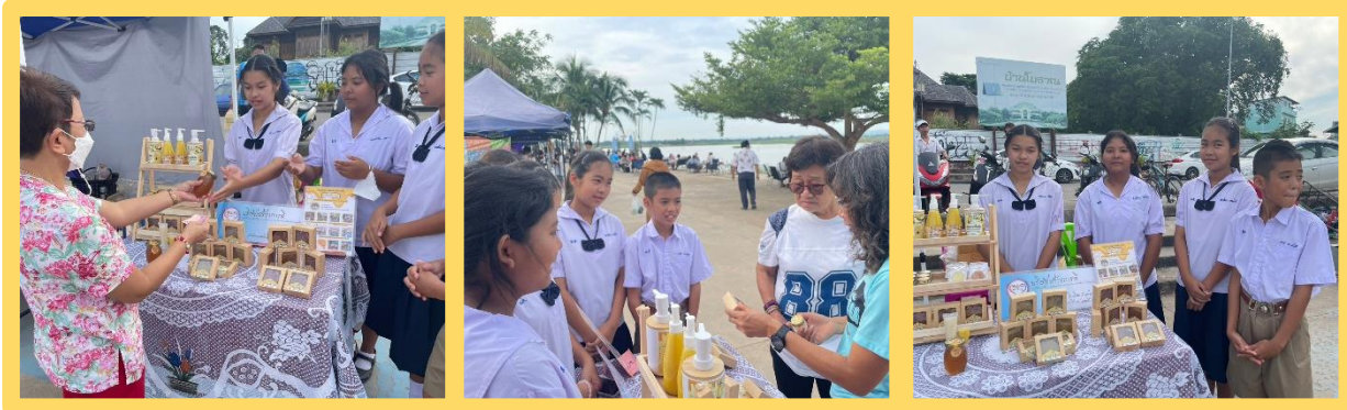
จัดจำหน่าย ณ ภาตเข้ากว๊านพะเยา ทุกวันเสาร์แรกของเดือน