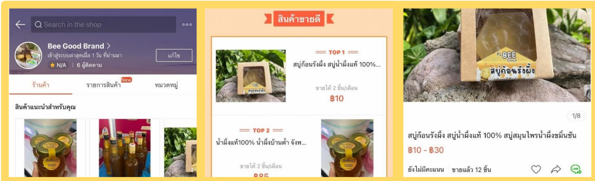
จัดจำหน่าย บนแอปพลิเคชัน Shopee ชื่อร้าน Bee Good Brand สินค้าขายดีที่สุด คือ สปูก่อนรังผึ้ง