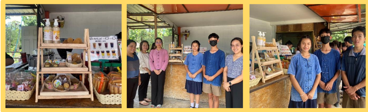
จัดจำหน่าย ณ ร้านค้าภายในชุมชนบ้านต้า