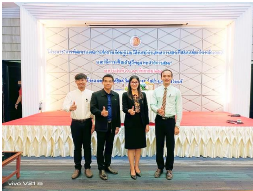
ภาพประกอบการดำเนินงาน