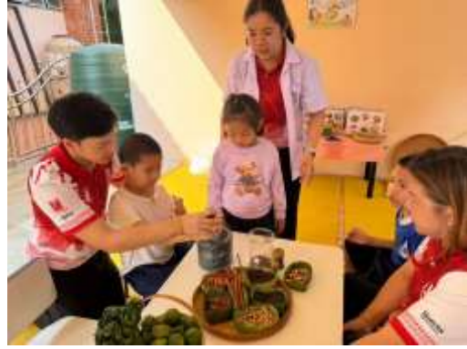
1.3) การผลิตไข่เค็มสมุนไพร