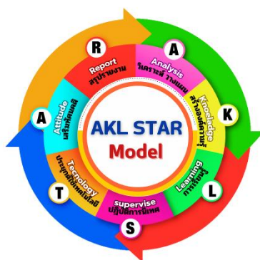
ภาพ ๓ รูปแบบการนิเทศภายในเพื่อส่งเสริมการจัดการเรียนรู้เชิงรุก (Active Learning) ด้วยรูปแบบ AKL STAR Model

๑.๑ ผลการพัฒนารูปแบบการนิเทศภายในเพื่อส่งเสริมการจัดการเรียนรู้เชิงรุก (Active Learning) ด้วยรูปแบบ AKL STAR Model ของโรงเรียนอนุบาลคลองลาน ประกอบด้วย ๗ องค์ประกอบดังนี้ ๑) วิเคราะห์วางแผน ๒) สร้างองค์ความรู้ ๓) การเรียนรู้ ๔) ปฏิบัติการนิเทศ ๕) ประยุกต์ใช้เทคโนโลยี ๖) เสริมทัศนคติ และ ๗) สรุปรายงาน ซึ่งมีรูปแบบดังภาพ ต่อไปนี้