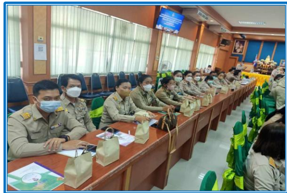
ภาพ : การเข้าร่วมประชุมเพื่อเสริมสร้างและพัฒนาองค์ความรู้