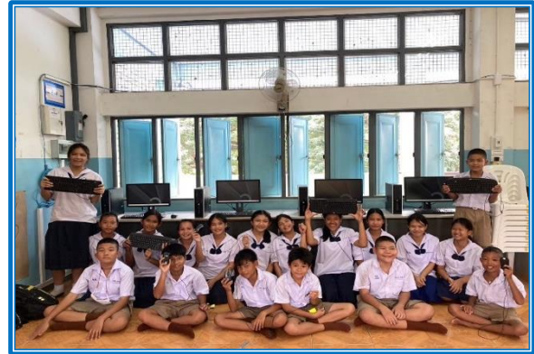
ภาพ : การสนับสนุนเครื่องคอมพิวเตอร์ใช้แล้วจากมูลนิธิกระเจกเงา

2. ได้รับการจัดสรร นวัตกรรมบอร์ดเกม (Board Game) เพื่อการเรียนรู้เชิงรุก (Active Learning) จากสำนักพัฒนาคุณภาพครูและสถานศึกษา กองทุนเพื่อความเสมอภาคทางการศึกษา (กสศ.)