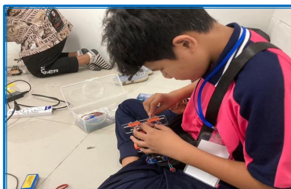
ภาพ : การจัดบริการอินเทอร์เน็ตให้กับนักเรียนได้ใช้แสวงหาความรู้