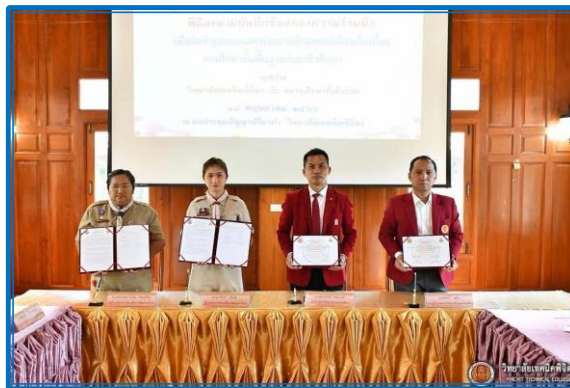
ภาพ : ทำ MOU กับวิทยาลัยเทคนิคพิจิตร