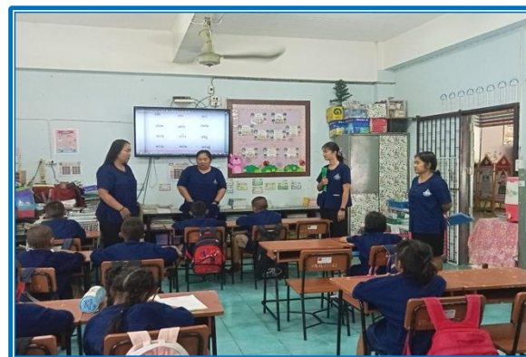
ภาพ : ครูนำเทคโนโลยีทางการศึกษามาใช้ในการจัดการเรียนการสอน