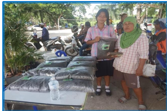
ภาพ : การจัดการเรียนการสอนหลักสูตรระยะสั้น (เกษตร)