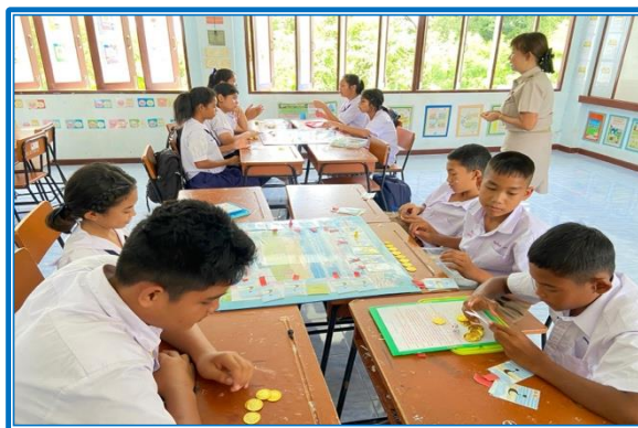
ภาพ : นวัตกรรมบอร์ดเกม (Board Game)