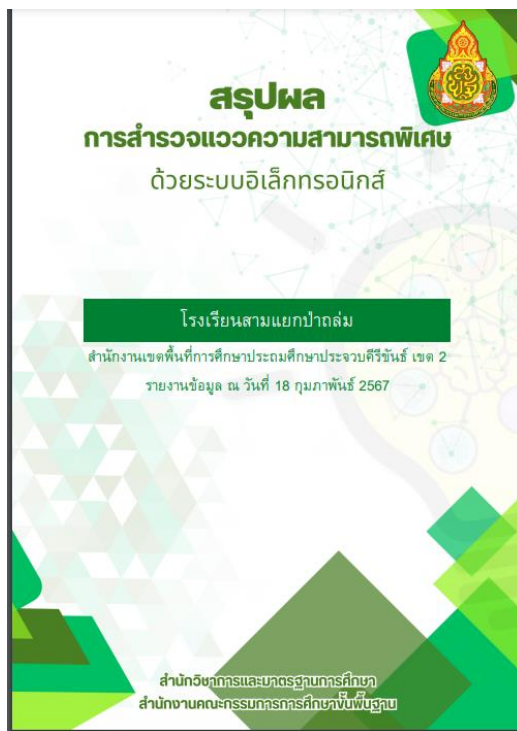
เล่มสรุปผลแบบรายโรงเรียน