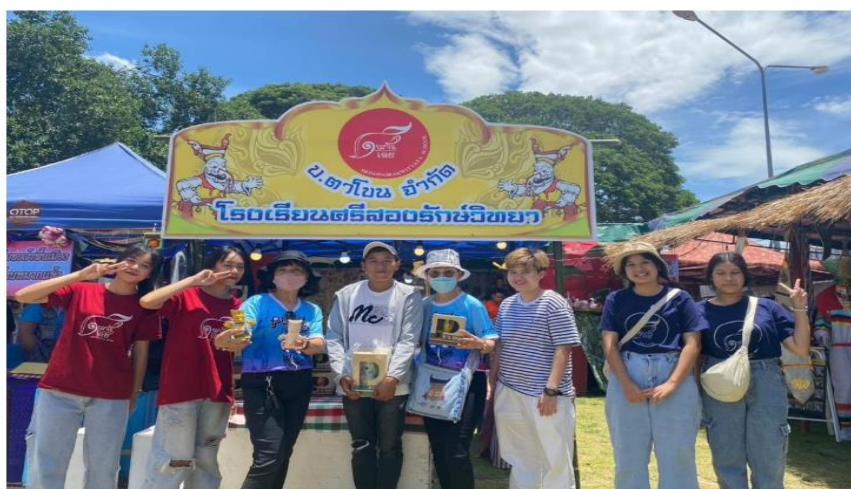
ร่วมกิจกรรมออกบูธจำหน่ายสินค้าในงานประเพณีบุญหลวงและการละเล่นผีตาโขน ประจำปี 2566