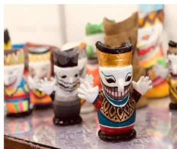
"แจกันตาโขนรักซ์โลก" ที่ผลิตจากกระจาด และฟางข้าว