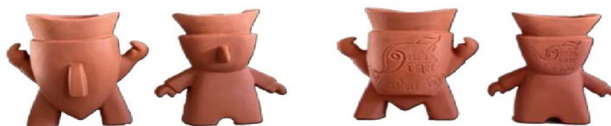
แจกันตาโชน Ver. 2