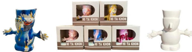
“แจกันตาโชนรักขโลก” ที่ผลิตเป็นแบบเซรามิก และตกแต่งโดยการใช้เทคนิคการจุ่มสี

ต่อมา เมื่อนักเรียนเริ่มนำผลงานออกวางจำหน่าย ได้รับการตอบรับทางการตลาดที่ดี มีลูกค้าสนใจสั่งซื้อผลิตภัณฑ์ในจำนวนที่สูงขึ้น นักเรียนในชุมนุมจึงต้องเร่งผลิตสินค้า แต่ทั้งนี้การเพิ่มกำลังการผลิตประสบปัญหาในส่วนของระยะเวลา เนื่องจากผลิตภัณฑ์ในแต่ละชิ้นจะต้องใช้เวลาในการทำค่อนข้างหลายวัน ทำให้เกิดข้อจำกัดทางการตลาด คุณครูอภิรัตน์ พรหมรักษา (คุณครูที่ปรึกษาชุมนุมหัตถศิลป์) จึงมีแนวคิดที่จะปรับเปลี่ยนรูปแบบของแจกันตาโชนรักขโลกจากเดิม ที่มีการใช้วัสดุเหลือใช้ และวัสดุธรรมชาติอย่างเดียว มาเป็นแจกันเซรามิก และปรับเปลี่ยนวิธีการตกแต่งผลิตภัณฑ์ จากเดิมที่จะเขียนลายตกแต่งที่ละตัว เป็นการตกแต่งโดยใช้เทคนิคการจุ่มสี จึงช่วยให้นักเรียนในชุมนุมสามารถผลิตผลิตภัณฑ์ได้คราวละมากๆ มีผลิตภัณฑ์ที่มีสีสันสดใสสวยงาม และยังมีลวดลายที่เป็นเอกลักษณ์ของแต่ละชิ้นไม่ซ้ำแบบกัน และยังได้ออกแบบบรรจุภัณฑ์ที่สวยงามเพิ่มมูลค่าของผลิตภัณฑ์ได้อีกด้วย