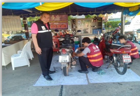
การแข่งขันทักษะ ประจำปีการศึกษา ๒๕๖๖ ระดับภาค

โครงการศูนย์อาชีวะอาสา ร่วมด้วยช่วยประชาชน (Fix it Center) เทศกาลปีใหม่ ปี พ.ศ. ๒๕๖๗