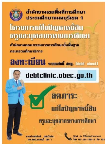
ที่ติดต่อ สนับสนุนวิทยากร ค.บางกระพือ อ.เมืองนนทบุรี จ.นนทบุรี 11000