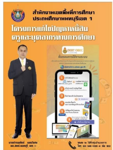
ที่ติดต่อ สนับสนุนวิทยากร ค.บางกระพือ อ.เมืองนนทบุรี จ.นนทบุรี 11000