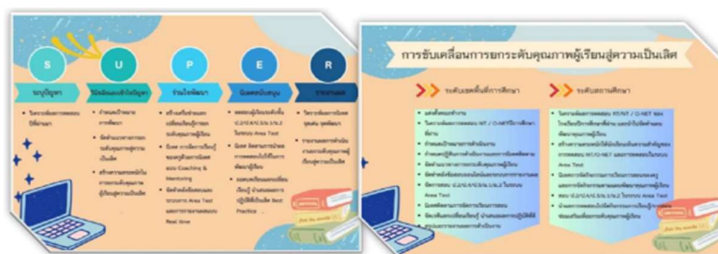
ภาพการทดสอบ SKW๑ AREA TEST

สำนักงานเขตพื้นที่การศึกษาประถมศึกษาสระแก้ว ดำเนินการประเมินคุณภาพผู้เรียนระดับเขตพื้นที่การศึกษา (SKW๑ Area Test) โดยใช้ระบบการเข้าทดสอบ และระบบรายงานออนไลน์ทดสอบ ใน ระดับชั้น ป.๒,ป.๔,ป.๕, ม.๑ และ ม.๒ วิชาภาษาไทย คณิตศาสตร์ วิทยาศาสตร์และเทคโนโลยี และ ภาษาอังกฤษ ระหว่างวันที่ ๖-๑๒ มีนาคม ๒๕๖๗